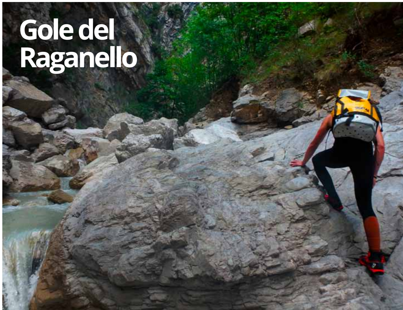
Gole del Raganello - Torrentismo

Dopo aver attraversato quasi tutta l'Italia da nord a sud, finalmente entriamo in Calabria , dal Parco Nazionale del Pollino .