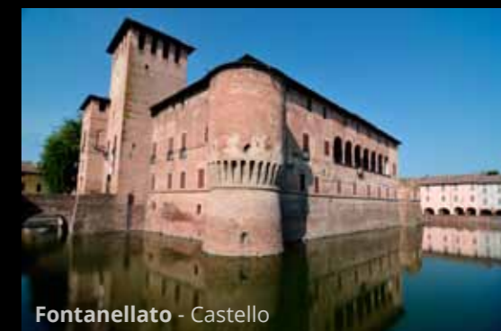
Fontanellato - Castello

Finalmente agosto. Finalmente le vacanze estive. Si parte per la Calabria , scartata, l'anno scorso all'ultimo, a favore dell'Olanda.