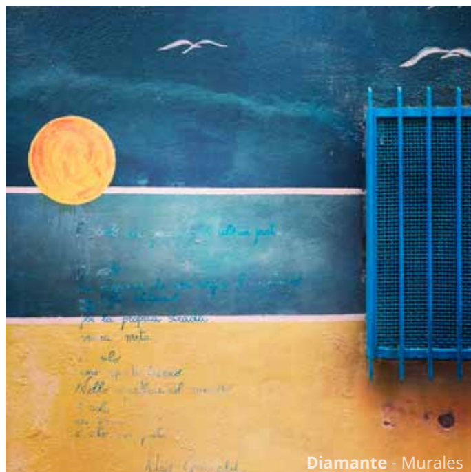
Diamante - Murales

Il tempo stringe e le vacanze stanno per finire. Così la tappa seguente la facciamo a Diamante , già visitata in occasione del viaggio in Basilicata di 2 anni fa, ma sempre gradita, anche grazie alla presenza dei numerosi graffiti sui muri delle case.