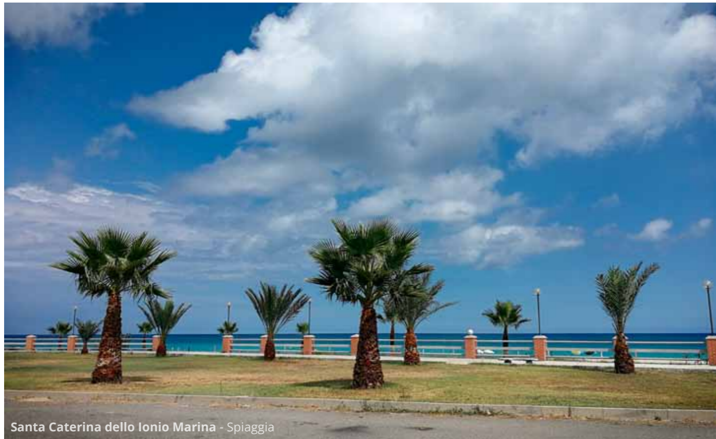
Santa Caterina dello Ionio Marina - Spiaggia

Tornati al mare, facciamo sosta libera nei pressi della spiaggia di Santa Caterina dello Ionio Marina . Poco più avanti, nei pressi di Monasterace, entriamo nel tratto di costa calabra denominato Riviera dei Gelsomini , nella Locride.