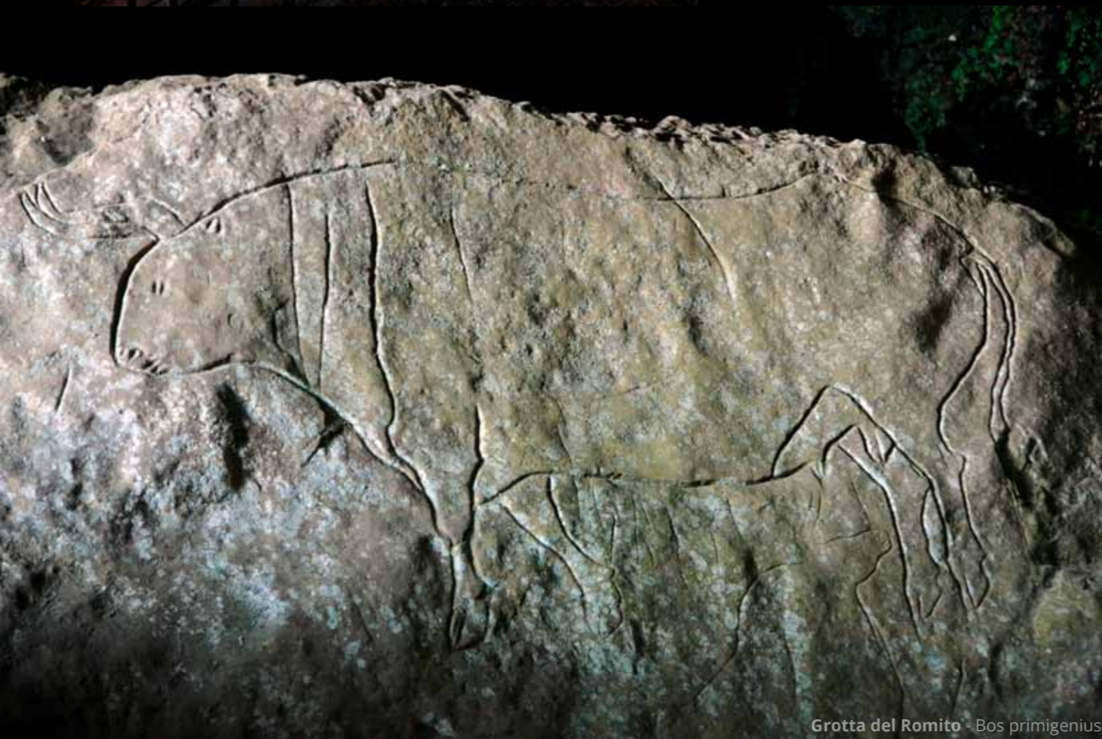
Grotta del Romito - Bos primigenius

Nel sito sono stati trovati numerosi reperti dell'età paleolitica, (alcuni dei quali sono esposti al Museo nazionale della Magna Grecia di Reggio Calabria) diverse sepolture e, visibile ancora in loco, un magnifico graffito raffigurante due bovini ( Bos primigenius ). La strada per arrivarci non è pensata per i camper, soprattutto l'ultimo tratto, ben oltre l'abitato di Papasidero, ma la visita merita la fatica!