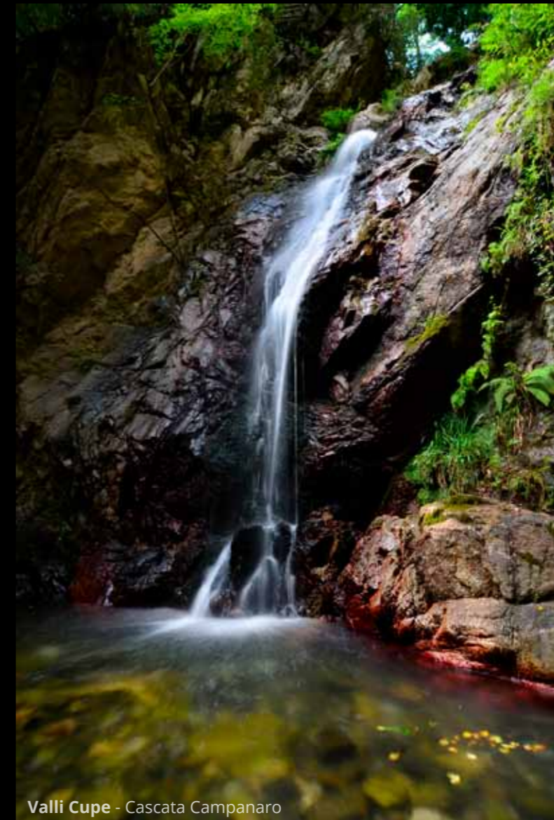
Valli Cupe - Cascata Campanaro

A seguire, raggiungiamo la Cascata Campanaro , molto suggestiva e a pochi minuti dalla strada asfaltata.