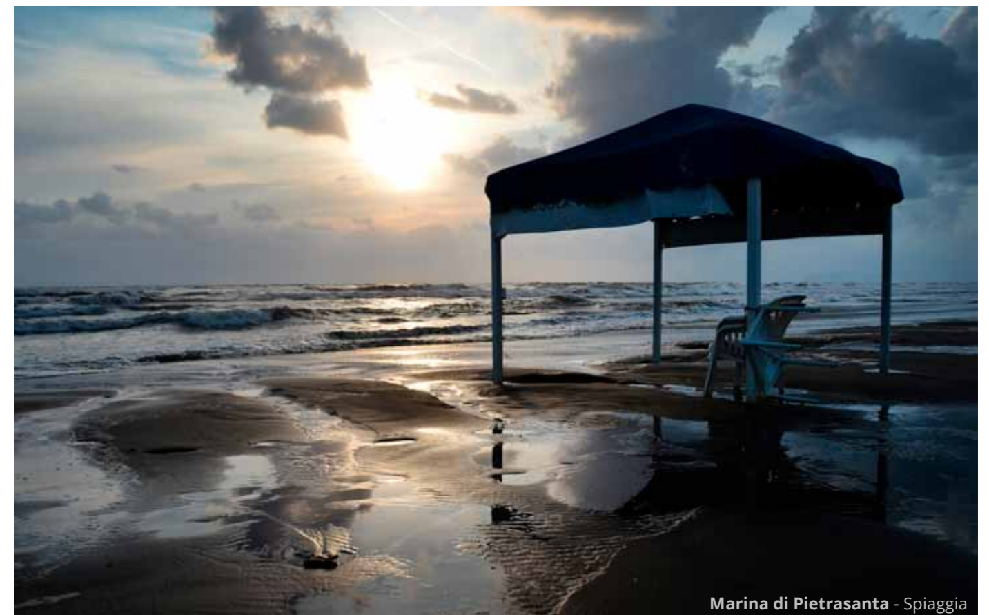
Marina di Pietrasanta - Spiaggia

Il giorno dopo si ripete: ancora A1 e poi, a Firenze, verso la Versilia per un ultimo bagno a Marina di Pietrasanta . I tragici eventi del Ponte Morandi a Genova ci costringono ad una deviazione lungo la Serravalle per il finale rientro a casa.