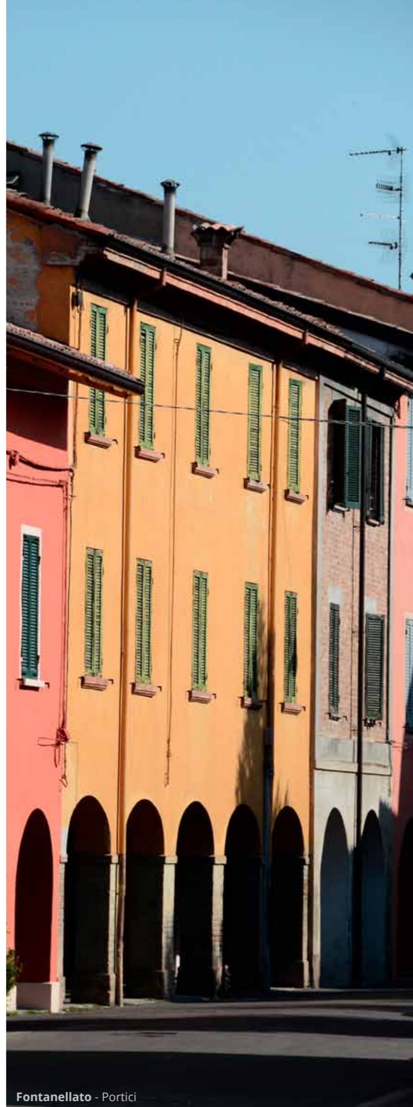
Fontanellato - Portici