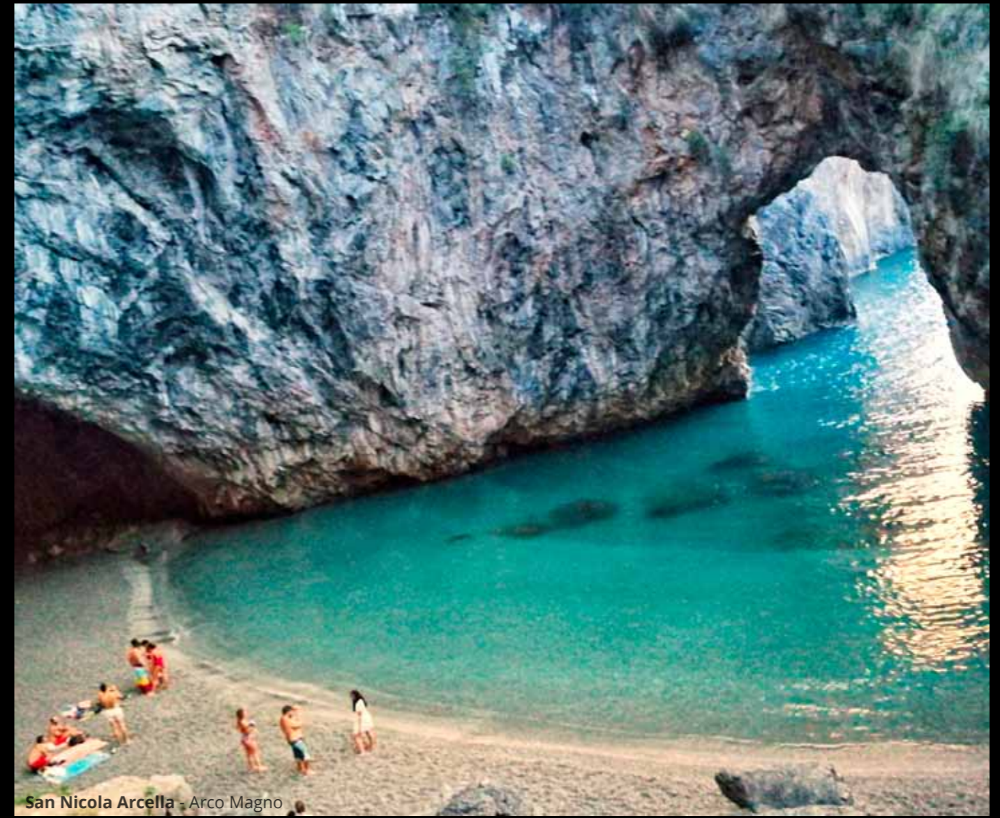
San Nicola Arcella - Arco Magno

Il tempo stringe e le vacanze stanno per finire. Così la tappa seguente la facciamo a Diamante , già visitata in occasione del viaggio in Basilicata di 2 anni fa, ma sempre gradita, anche grazie alla presenza dei numerosi graffiti sui muri delle case.