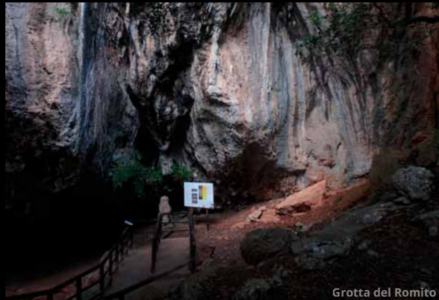
Grotta del Romito

Come ultima tappa del nostro tour della Calabria in camper decidiamo di spingerci all'interno, verso Papasidero, nel Parco del Pollino, per visitare un sito archeologico preistorico di estrema importanza: la Grotta del Romito .