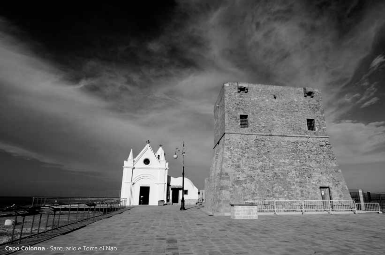
Capo Colonna - Santuario e Torre di Nao

Poi Capo Colonna e l'area archeologica di Capo Colonna con i resti del tempio di Hera Lacinia.