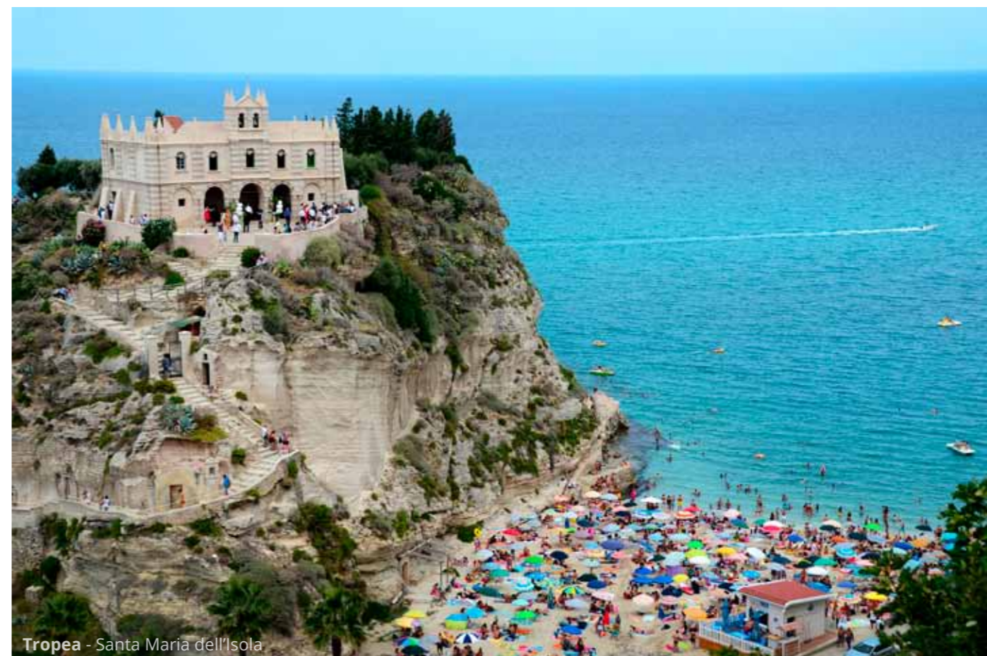
Tropea - Santa Maria dell'Isola

Così viaggiamo da Nicotera a Capo Vaticano . Le strade sono al limite dell'agibilità, per via di un violento temporale e deviazioni più o meno permanenti.