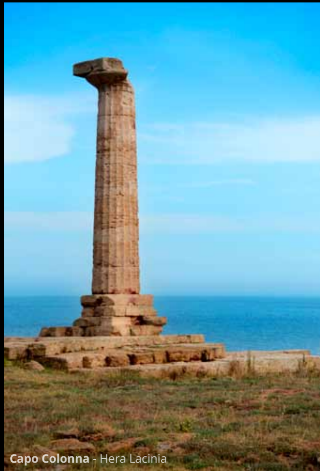
Capo Colonna - Hera Lacinia