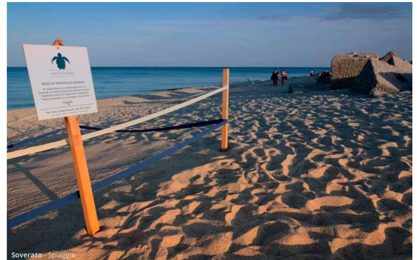
Soverato - Spiaggia

Nell'ampia spiaggia di Soverato , nel cuore della Costa degli Aranci , facciamo il bagno accanto a un nido di tartaruga marina ( Caretta caretta ).