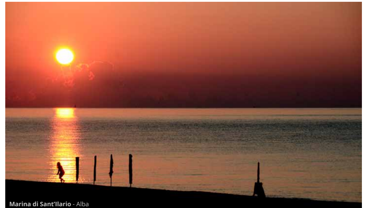
Marina di Sant'Ilario - Alba

Dopo il pieno di granite (forse tra le più buone di tutta la vacanza) scendiamo sul mare per rinfrescarci ulteriormente a Marina di Sant'Ilario .