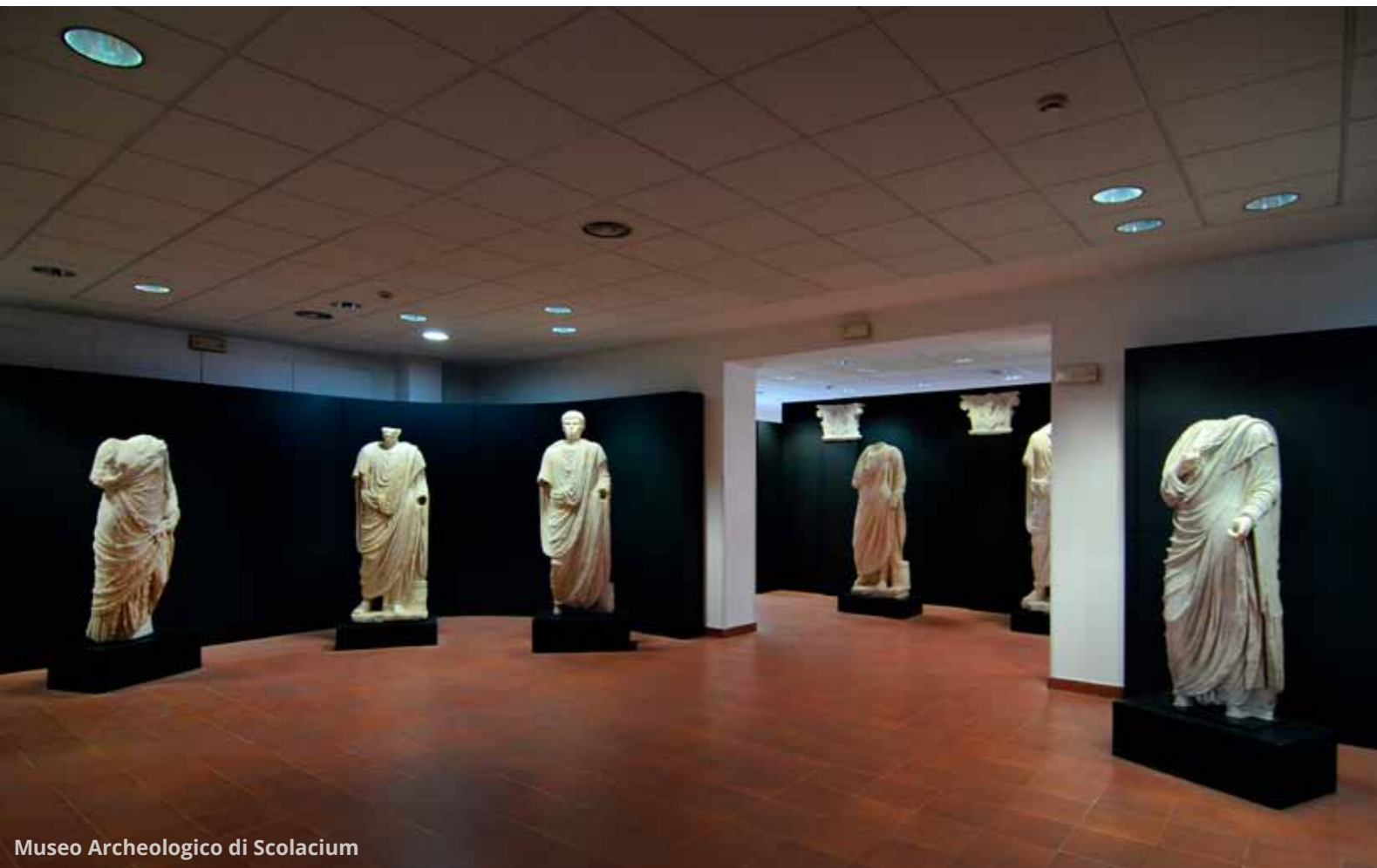
Museo Archeologico di Scolacium

Rientrati dall'escursione alle Valli Cupe, proseguiamo il nostro tour della Calabria lungo la SS106 Ionica , costeggiando il Golfo di Squillace, in provincia di Catanzaro. Ci fermiamo a visitare il Parco Archeologico di Scolacium , sede di un'antica colonia greca e poi romana. Tra ulivi secolari e alberi di fichi dolcissimi ammiriamo i resti del foro, del teatro e dell'anfiteatro, una necropoli etrusca, una basilica normanna (incompiuta) ed un interessante museo archeologico.