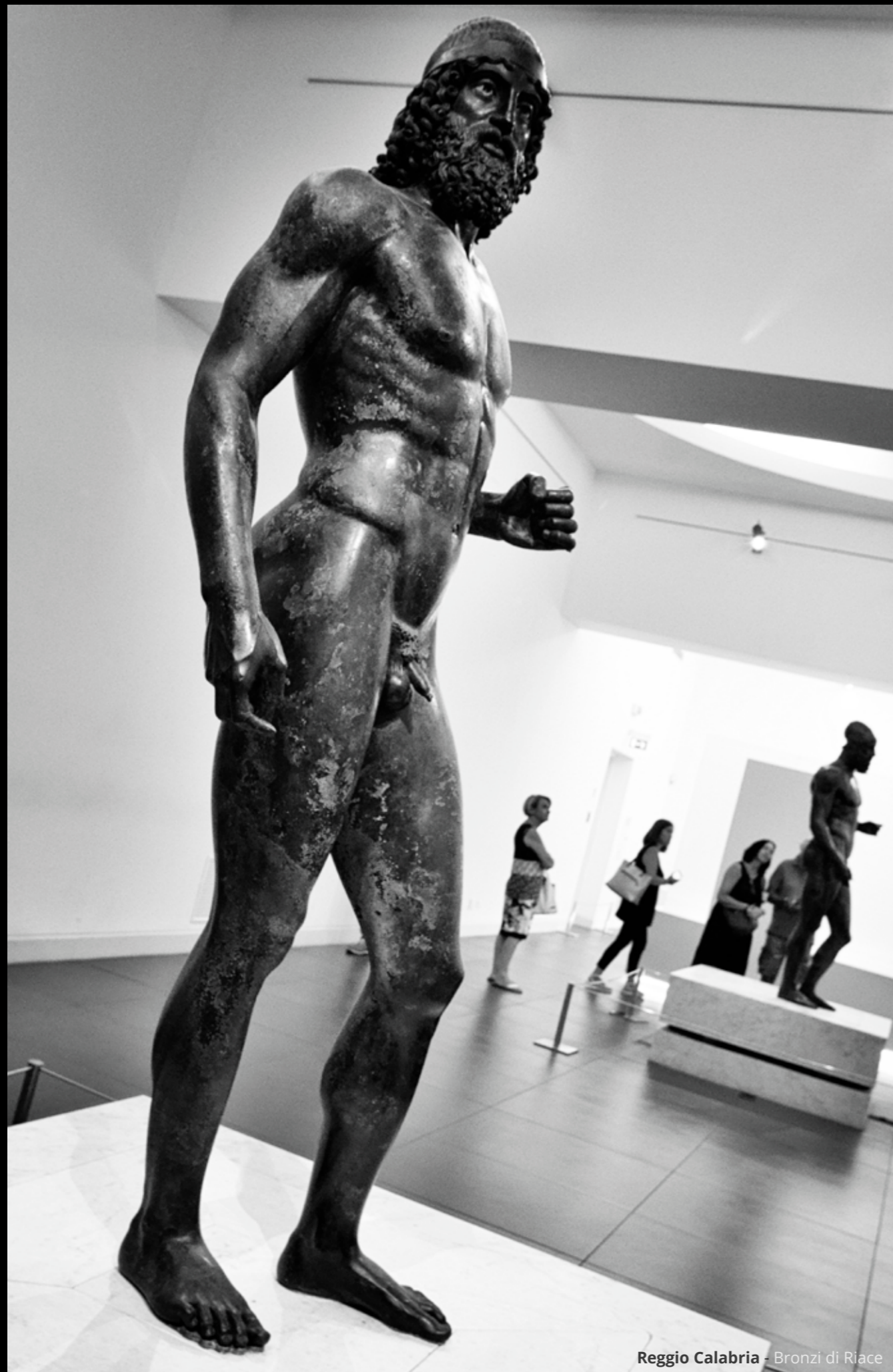
Reggio Calabria - Bronzi di Riace