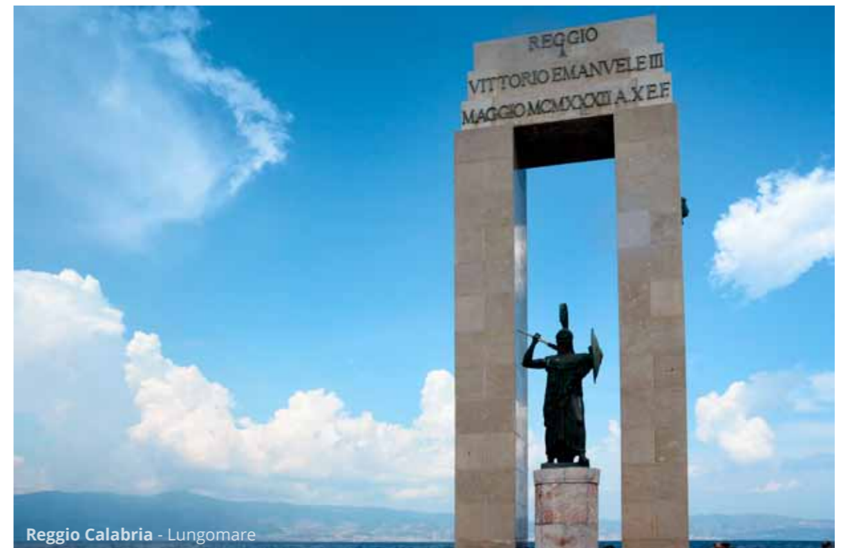
Reggio Calabria - Lungomare

Ci fermiamo per una visita a piedi del centro di Reggio di Calabria . Facciamo quindi pranzo in una delle gelaterie del lungomare con vista sulla Sicilia(!) e poi passiamo il pomeriggio al Museo nazionale della Magna Grecia dove sono esposti i Bronzi di Riace .