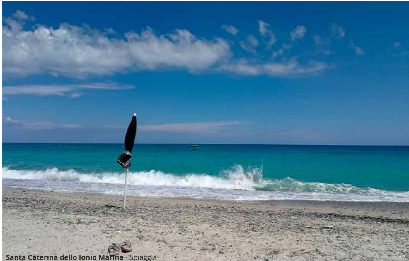
Santa Caterina dello Ionio Marina - Spiaggia

Tornati al mare, facciamo sosta libera nei pressi della spiaggia di Santa Caterina dello Ionio Marina . Poco più avanti, nei pressi di Monasterace, entriamo nel tratto di costa calabra denominato Riviera dei Gelsomini , nella Locride.