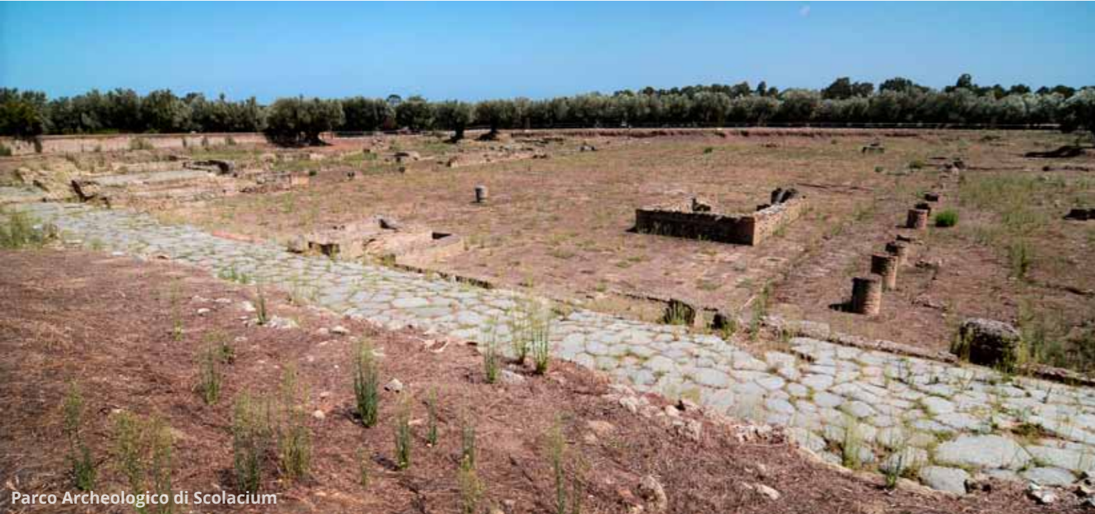
Parco Archeologico di Scolacium

Rientrati dall'escursione alle Valli Cupe, proseguiamo il nostro tour della Calabria lungo la SS106 Ionica , costeggiando il Golfo di Squillace, in provincia di Catanzaro. Ci fermiamo a visitare il Parco Archeologico di Scolacium , sede di un'antica colonia greca e poi romana. Tra ulivi secolari e alberi di fichi dolcissimi ammiriamo i resti del foro, del teatro e dell'anfiteatro, una necropoli etrusca, una basilica normanna (incompiuta) ed un interessante museo archeologico.