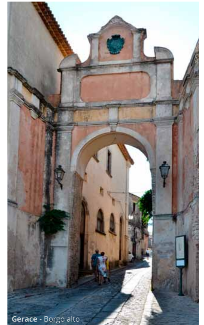
Gerace - Borgo alto

Dopo il pieno di granite (forse tra le più buone di tutta la vacanza) scendiamo sul mare per rinfrescarci ulteriormente a Marina di Sant'Ilario .