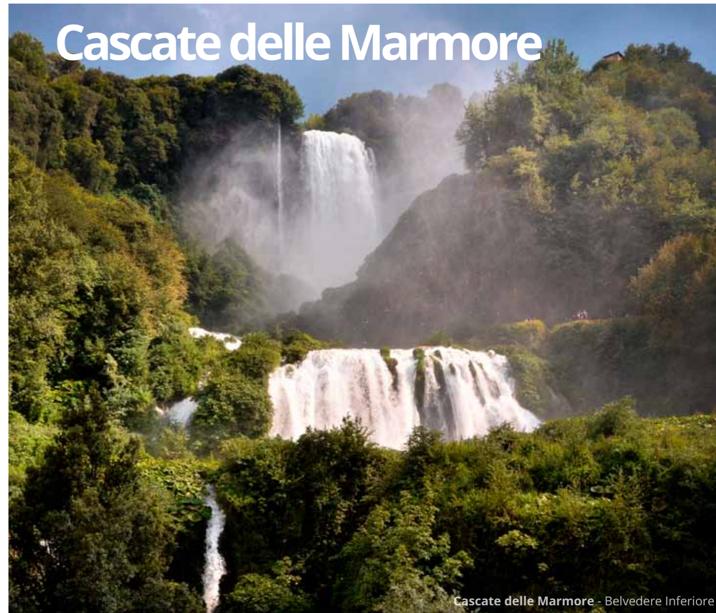
Cascate delle Marmore - Belvedere Inferiore