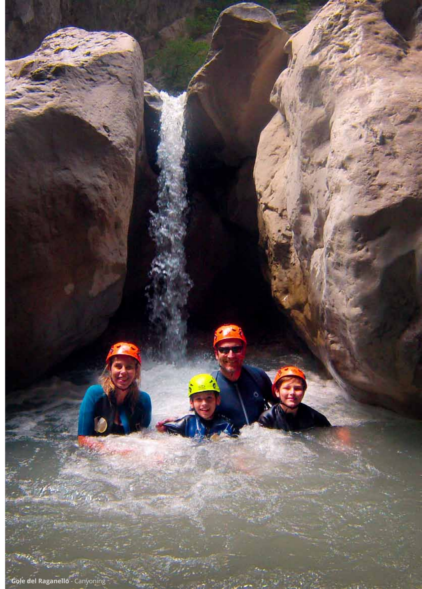
Gole del Raganello - Canyoning