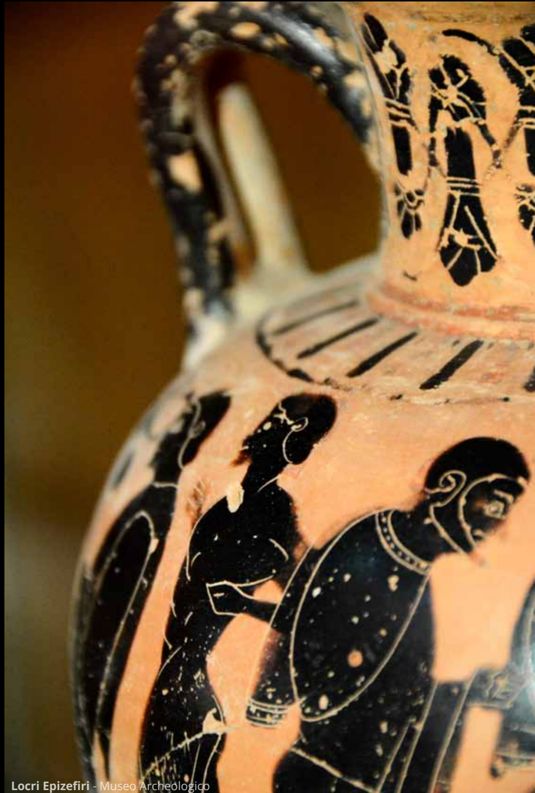
Locri Epizefiri - Museo Archeologico

Lungo la Statale 106 Ionica , a poca distanza da Sant'Ilario, si attraversa uno dei siti archeologici di maggiore interesse di tutta la Calabria, si tratta di Locri Epizefiri . Ci fermiamo a visitarlo dopo una giornata in spiaggia. Oltre al museo archeologico è possibile visitare gli scavi dell'antica città, del teatro e di altri edifici.