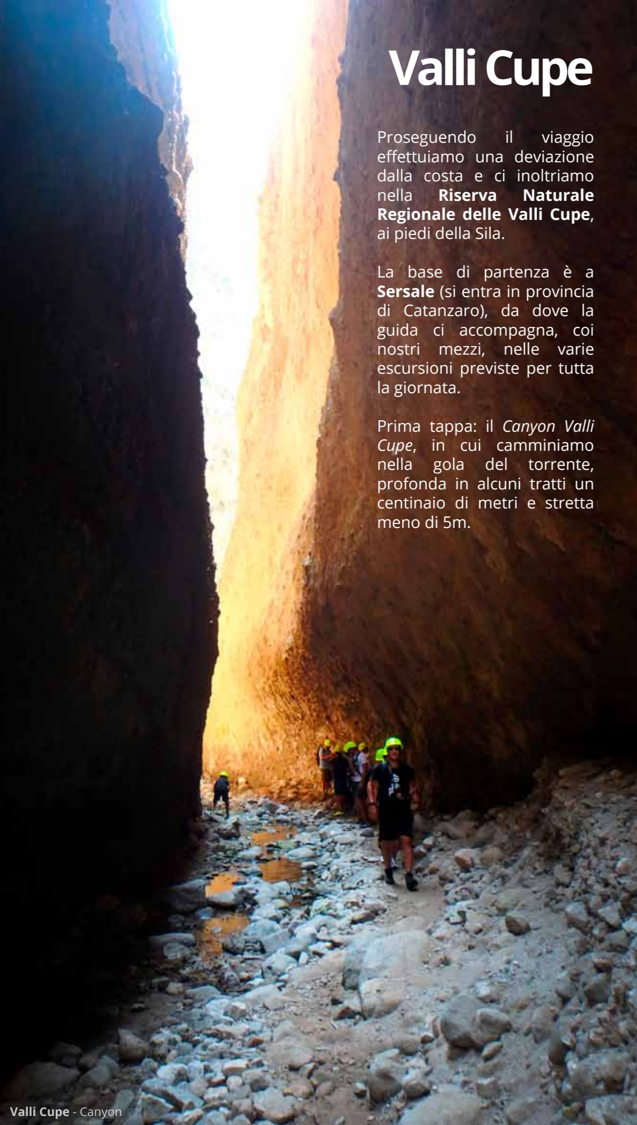
Valli Cupe - Canyon

Prima tappa: il Canyon Valli Cupe , in cui camminiamo nella gola del torrente, profonda in alcuni tratti un centinaio di metri e stretta meno di 5m.