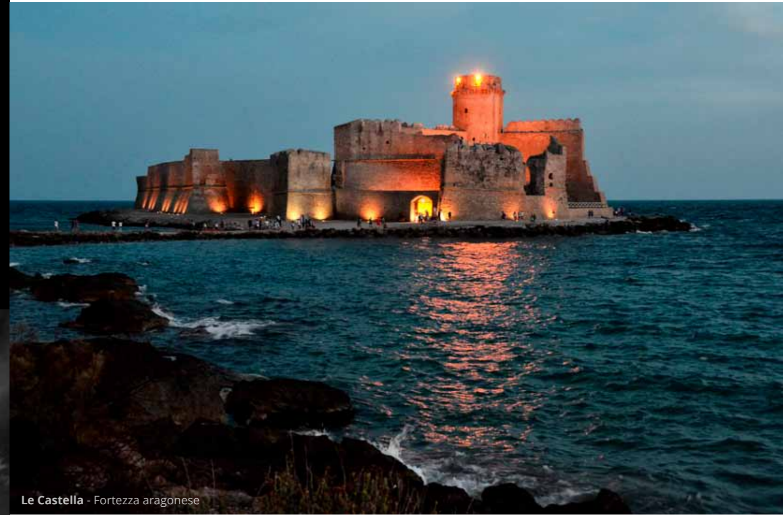
Le Castella - Fortezza aragonese

La Costa dei Saraceni , caratterizzata da spiagge di sabbia mista sassi e mare cristallino, include al suo interno l' Area marina protetta Capo Rizzuto , che si estende da Crotona a Le Castella . Di quest'ultima, oltre al borgo vivace, visitiamo l'imponente fortezza aragonese, costruita su una piccola penisola e collegata alla terraferma da uno stretto passaggio fra 2 spiagge.