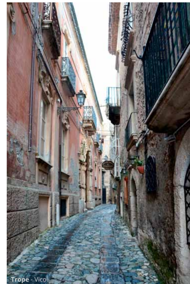
Tropea - Vicoli