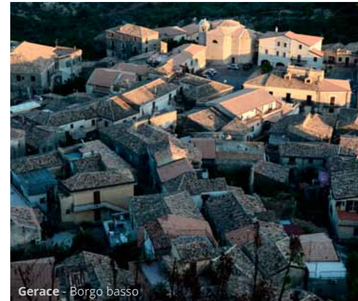
Gerace - Borgo basso

Tornati sulla litoranea, risaliamo poco dopo per raggiungere Gerace , separato in due abitati. Il borgo di sotto è composto da stretti vicoli pedonali tra case basse. Il borgo di sopra è molto più sontuoso: piazzette, negozi, ristoranti, antichi palazzi e chiese.