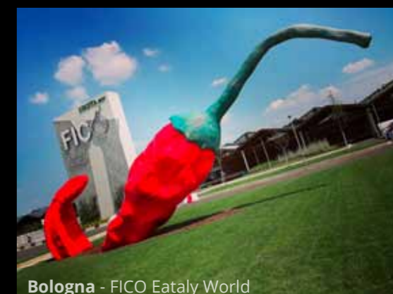
Bologna - FICO Eataly World

L'indomani proseguiamo per Bologna, dove visitiamo il parco FICO Eataly World... una delusione! Praticamente un Eataly gigante, molto curato in ogni singolo dettaglio ma tutto troppo caro. Le attività extra come laboratori, eventi, corsi... sono tutte a pagamento.