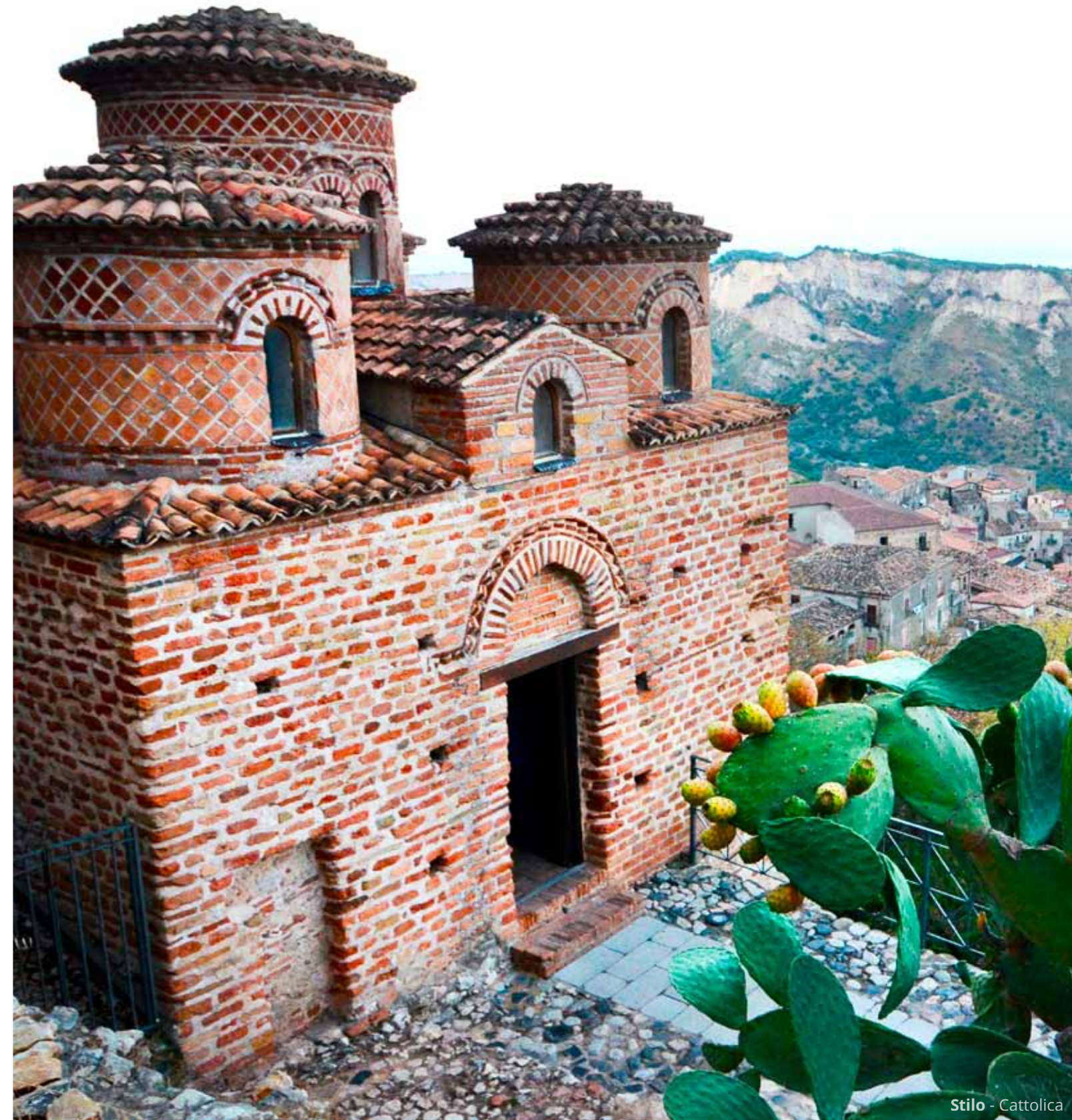
Stilo - Cattolica

Un buon modo per visitare la Calabria sembra essere quello di passare la giornata al mare ed andare a dormire al fresco, sugli antichi borghi montani. Così dopo un altro bagno nello Ionio, arriviamo al tramonto per visitare Stilo e la sua Cattolica , antica chiesa bizantina, e scopriamo che il paese è in festa patronale. Assistiamo quindi alla processione ed ai festeggiamenti con i fuochi artificiali.