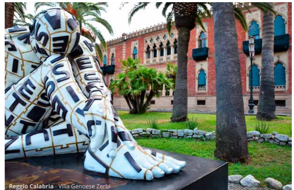
Reggio Calabria - Villa Genoese Zerbi