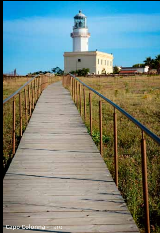
Capo Colonna - Faro